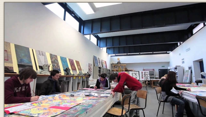
una delle aule del Liceo utilizzate per i corsi professionali

Corso professionale "Restauro e conoscenza della ceramica archeologica" in collaborazione con il Museo archeologico statale Gaio Cilnio Mecenate di Arezzo